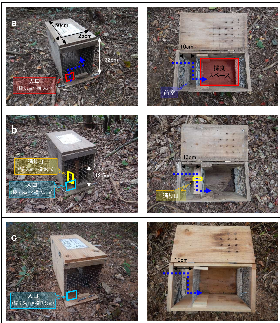
写真 1-2 改良したベイトステーションの構造

よるソーセージベイトの採食が確認された。また、ネコがベイトステーションの入り口に頭部を侵入させる様子が撮影されたが、混獲対策を施したベイトステーションでは、採食スペースまでの侵入は確認されなかった。以上のことから、大型のマングースによるベイトの採食が可能（入口：7.5cm×7.5cm）かつ、ネコの混獲対策を施したベイトステーションが最も適した形状と考えられる。