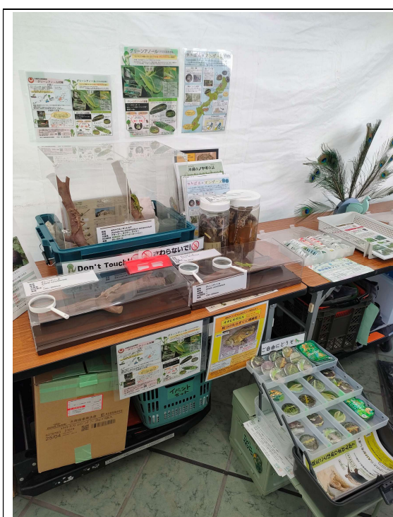
環境フェアの様子

普及啓発では、「令和7年度おきなわアジェンダ21 県民環境フェア in なは」において、マングースに関する展示を実施したほか、NPO 法人東村観光推進協議会と連携し、沖縄科学技術大学院大学の博士課程学生向けのワークショップに講師として参加した。また、Team Come Back ヤンバルクイナたち主催のシンポジウム「ノグチゲラ 名護市に Come Back! ～名護市の森の可能性～」において、本事業の経緯や成果、希少鳥類の回復状況等について発表した。