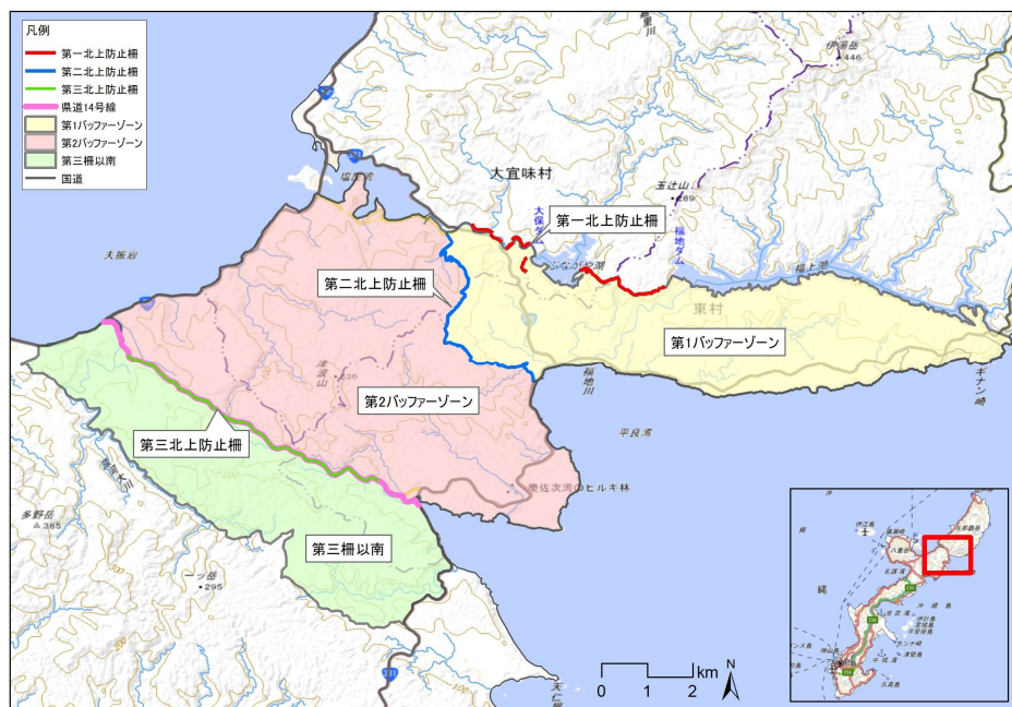
図 1-2 沖縄県捕獲対象地域

わなによる年間捕獲努力量の目標値は、第1バッファゾーンで130,000 わな日以上、第2バッファゾーンで200,000 わな日以上の計330,000 わな日以上を目標とした。