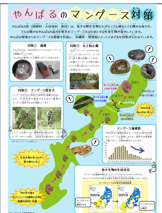
環境フェアにおける展示物