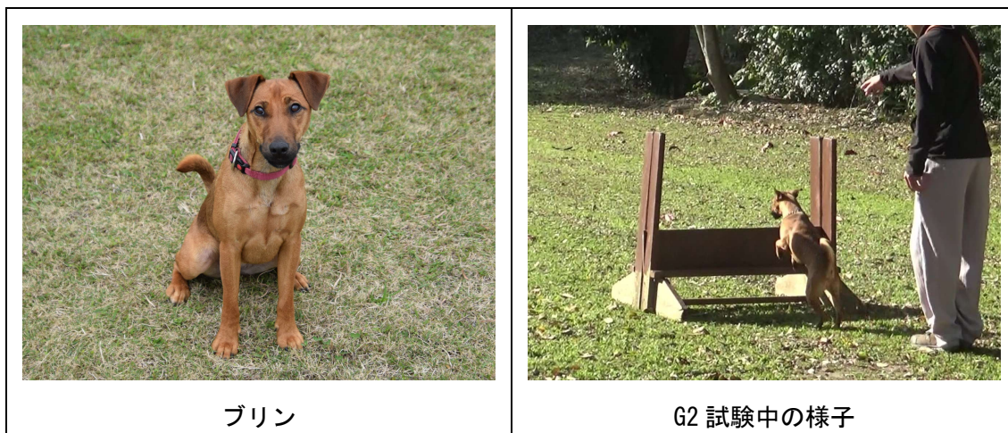
写真 1-3 新規探索犬（プリン）

新規探索犬として、テリア系1頭（名称：プリン）の育成を行った。令和7年10月に警察犬の試験科目となる服従第1科目（G1）試験に合格した。その後、より高度な服従訓練を行い、令和8年2月に服従第2科目（G2）試験に合格した。