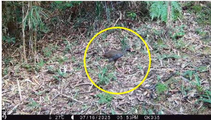
写真 1-4 名護市源河において撮影されたヤンバルクイナ（令和7年7月16日撮影）