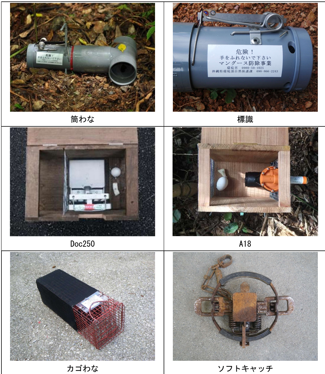
写真 1-1 わな